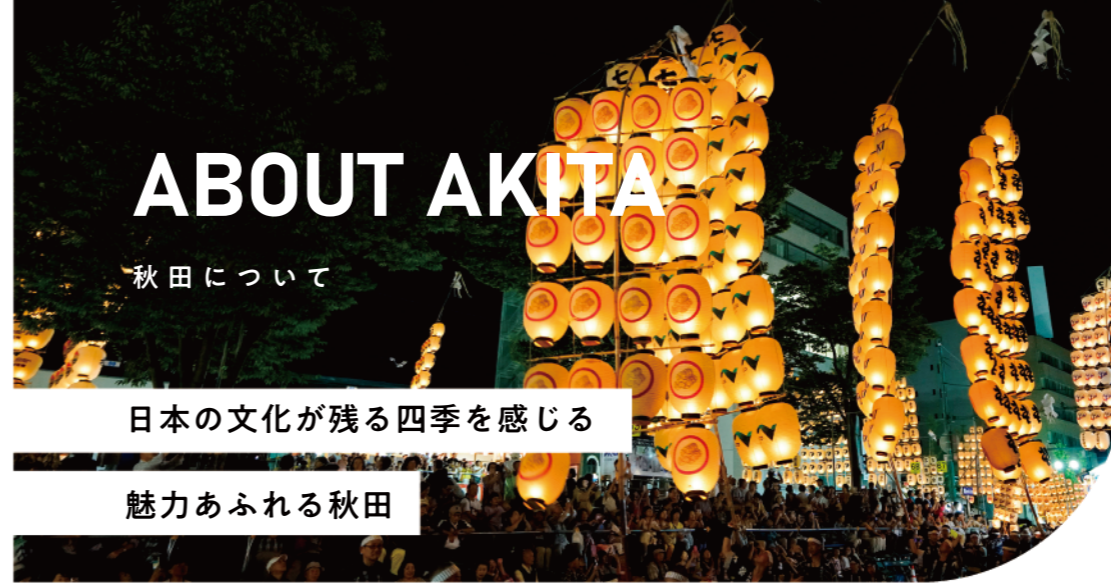
竿燈まつり Kanto Festival

A: 生活のことは生活相談スタッフ、勉強のことは教員にいつでも相談できます。また、3ヶ月に1回、個人面談を行っています。 You can always consult with the life counseling staff about life and the faculty about studying. In addition, we hold personal interviews once every three months.